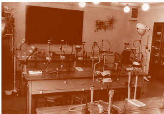
Ryc. 3. Sala ćwiczeń fantomowych z lat 70. XX w.